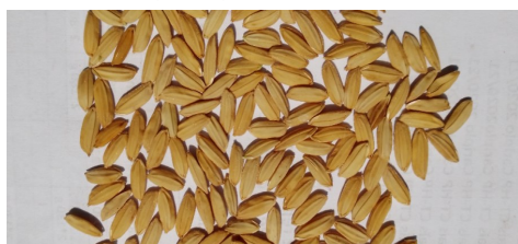
Grains décortiqués (riz cargo)